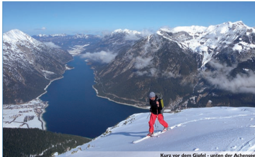
Kurz vor dem Gipfel - unten der Achensee

Bemerkung: Steile Frühjahrsstour - nur bei sehr sicheren Verhältnissen machbar! Vom Wegweiser unterhalb des Gipfels kann man auch rechts - 50 Hm abfahren - zum Weißenbachtal und von dort auf das Stanser Joch bzw. den Ochsenkopf steigen (siehe Karte). Oft wird auch von Maurach durch das Weißenbachtal aufgestiegen.