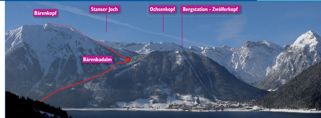
Die Aufstiegsroute auf den Bärenkopf