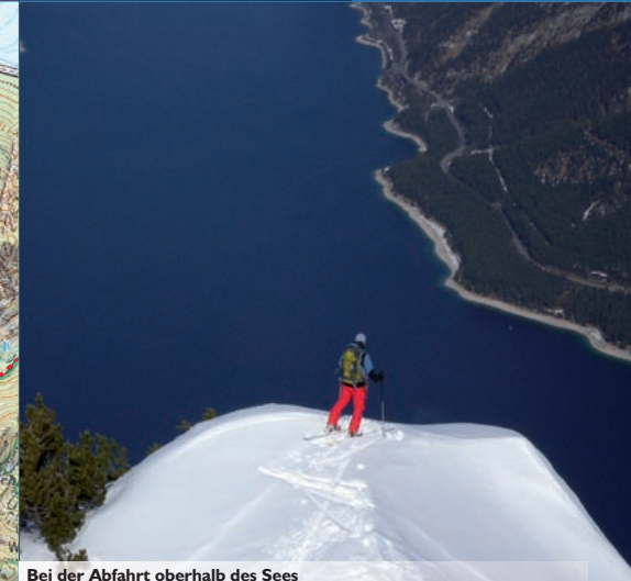
Bei der Abfahrt oberhalb des Sees