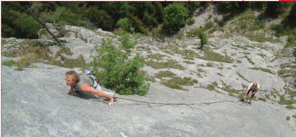
In der Route „Weberknecht“ an der oberen Diesbachwand; Foto: Axel Jentzsch-Rabl