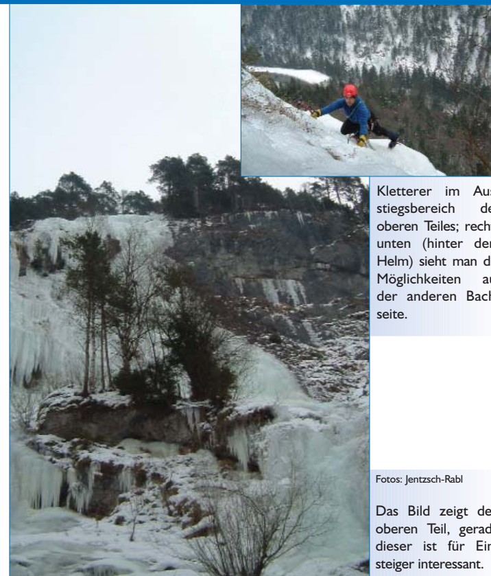
Kletterer im Ausstiegsbereich des oberen Teiles; rechts unten (hinter dem Helm) sieht man die Möglichkeiten auf der anderen Bachseite.