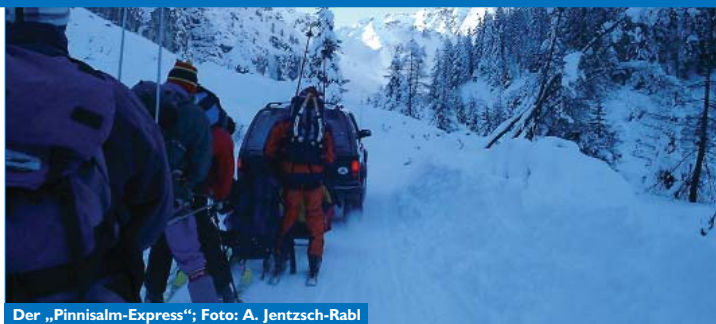
Der „Pinnisalm-Express“