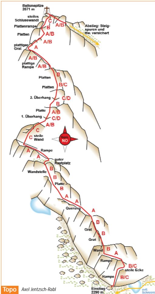
Topo Axel Jentsch-Rabl