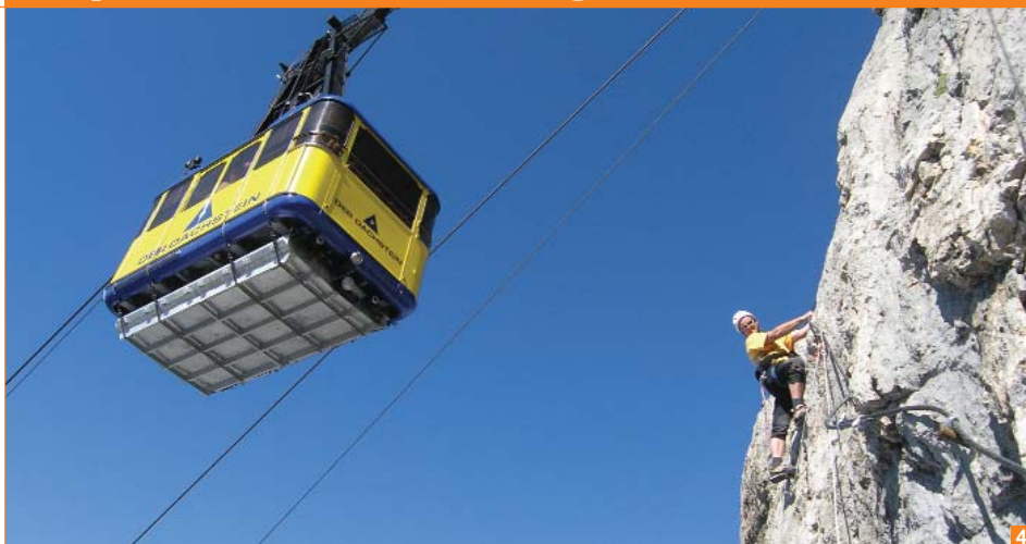
Bild 4: Karl Höflechner in der steilen Schlusswand, diese ist direkt unter der Seilbahn!

Route: Von der Abzweigung des Hunerscharten-Klettersteiges (B) zuerst leicht (A), dann etwas schwerer (B/C) auf einer Art Band bis zum ersten steilen Pfeiler leicht absteigend queren. Dort sehr steil (D) aufwärts und am Schluss in leicht überhängender Kletterei (C/D) zu dessen Ende. Es folgt eine Plattenquerung (D), die in einer mit einem Riss durchzogenen Steilwand mündet (D). Am Plattenende quert man kurz zum Pfeiler und klettert extrem ausgesetzt höher (anhaltend E!) bis man oben erneut zu einer kurzen Linksquerung (D) kommt. Steil aufwärts in die Schlusswand (D), die erneut in eine leichter werdende Querung (C) mündet. Am Ende über einen Grat (B) in flaches Gelände vor der Absperrung. Über den Zaun und rechts hinauf zur Sky Walk Plattform.