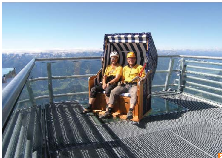
Bild 5: Geschafft! Eine gemütliche Rast im Strandkorb auf dem Sky Walk. Beide natürlich vorschriftsmässig am Korb gesichert :-)

Route: Von der Abzweigung des Hunerscharten-Klettersteiges (B) zuerst leicht (A), dann etwas schwerer (B/C) auf einer Art Band bis zum ersten steilen Pfeiler leicht absteigend queren. Dort sehr steil (D) aufwärts und am Schluss in leicht überhängender Kletterei (C/D) zu dessen Ende. Es folgt eine Plattenquerung (D), die in einer mit einem Riss durchzogenen Steilwand mündet (D). Am Plattenende quert man kurz zum Pfeiler und klettert extrem ausgesetzt höher (anhaltend E!) bis man oben erneut zu einer kurzen Linksquerung (D) kommt. Steil aufwärts in die Schlusswand (D), die erneut in eine leichter werdende Querung (C) mündet. Am Ende über einen Grat (B) in flaches Gelände vor der Absperrung. Über den Zaun und rechts hinauf zur Sky Walk Plattform.