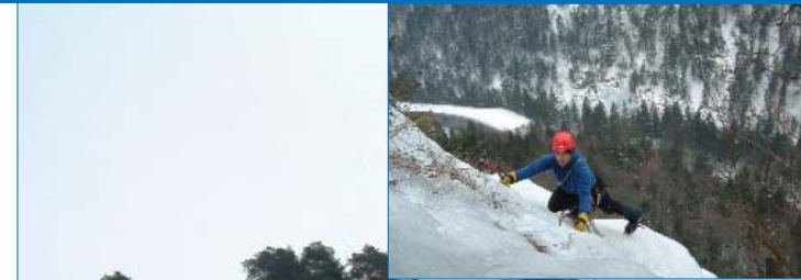
Kletterer im Ausstiegsbereich des oberen Teiles; rechts unten (hinter dem Helm) sieht man die Möglichkeiten auf der anderen Bachseite.